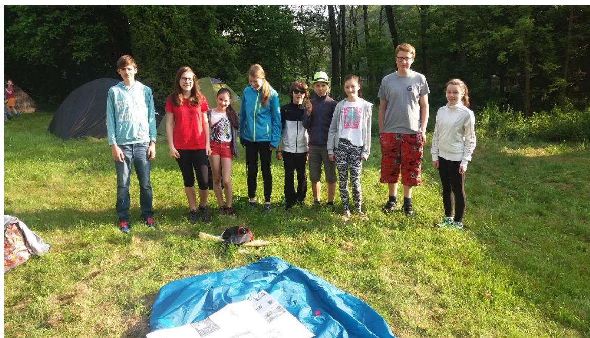
Účastníci soutěže „Zlatý list“.

V průběhu roku pracovali žáci výtvarné výchovy 1.A a 5.E na projektu Nalézání zmizelých osudů. Díla, která vznikla, budou k vidění na připravované výstavě. V rámci projektu navštívili vybraní žáci zajímavá místa Česka, Slovenska a Polska, kde pod vedením fotografa Michala Sironě vytvářeli fotografické impresy.