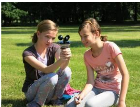
Zeměpisné dny nižšího gymnázia ve Stromovce, 27. 6. 2014