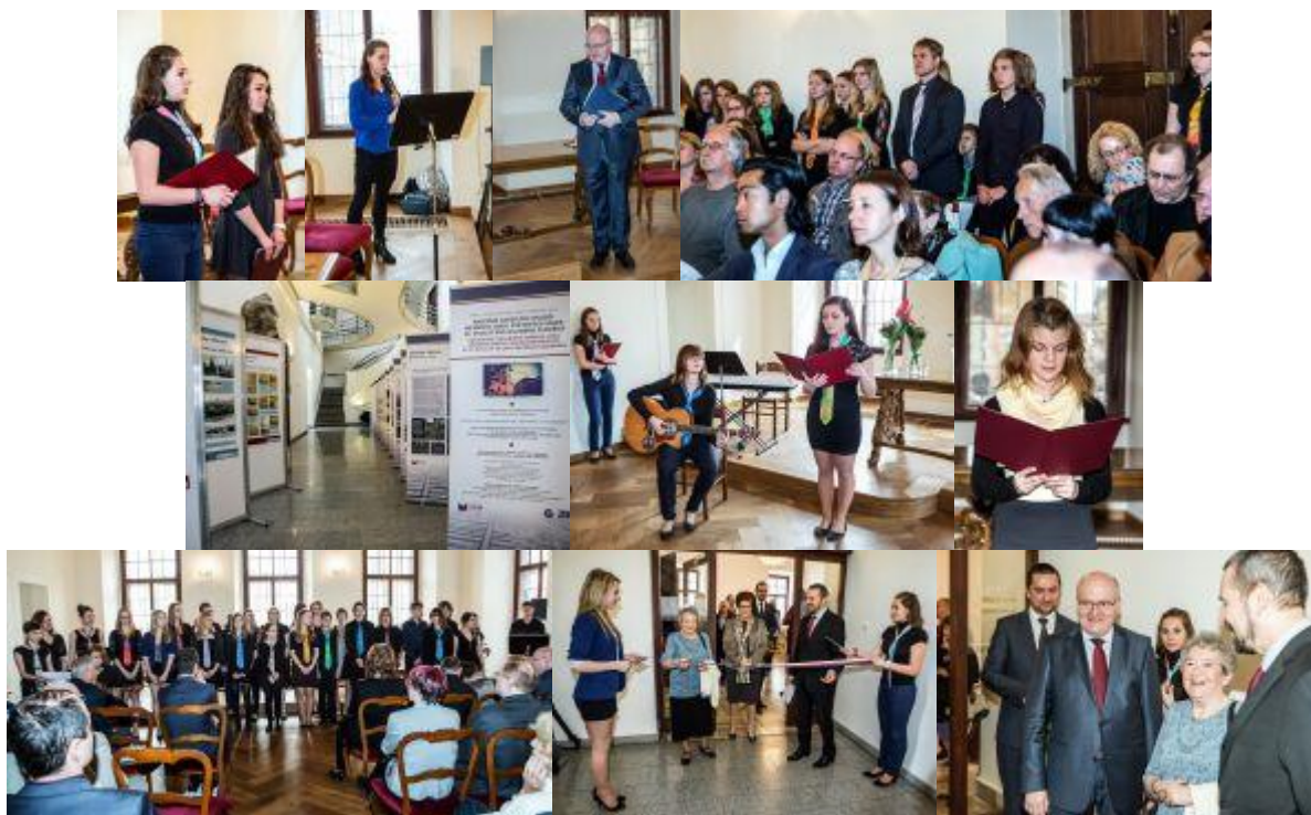
Nalézání zmizelých osudů, 10. 4. 2014