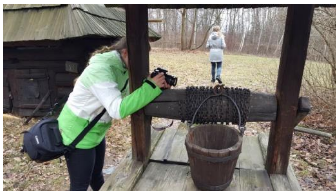
Exkurze Osvětim, Krakov (1.A,5.E)

V průběhu roku pracovali žáci výtvarné výchovy 1.A a 5 .E na projektu Nalézání zmizelých osudů. Díla, která vznikla, budou k vidění na připravované výstavě. V rámci projektu navštívili vybraní žáci zajímavá místa Česka, Slovenska a Polska, kde pod vedením fotografa Michala Sironě vytvářeli fotografické impresie. Nejlepší fotografie jsou k vidění na malé výstavě v podkrovních prostorách školy.