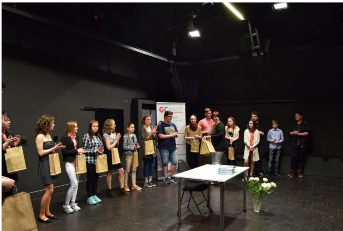
Velmi úspěšné bylo i školní kolo soutěže v předčítání v němčině, které se poprvé konalo v nové školní aule.