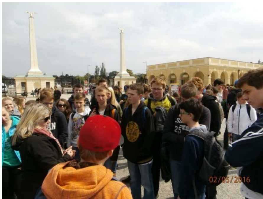
6. E odjela s p. učitelkou Chytil do St. Pöltenu na Den Evropy