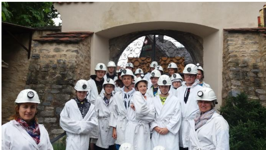
Skupina studentů před vstupem do středověkého dolu.

Dalším výsledkem mezipředmětové spolupráce byla dvoudenní exkurze s přírodovědně-historicko-geografickým zaměřením do Kutné Hory a Prachovských skal. Exkurze se zúčastnili studenti nižšího gymnázia. V Kutné Hoře jsme navštívili České muzeum stříbra a středověký důl, kde jsme se seznámili nejen se způsobem těžby a zpracování stříbra ve středověku, ale i s historií Kutné Hory. Vybaveni svítilnou, helmou a hornickou halenou perkytlí jsme prošli 250 metrů dlouhou částí původního středověkého dolu. Při průchodu štolou bylo také možné pozorovat krasové a pseudokrasové jevy. Druhá část exkurze byla zaměřena na geologickou stavbu skalního města Prachovské skály a určování vyšších rostlin.