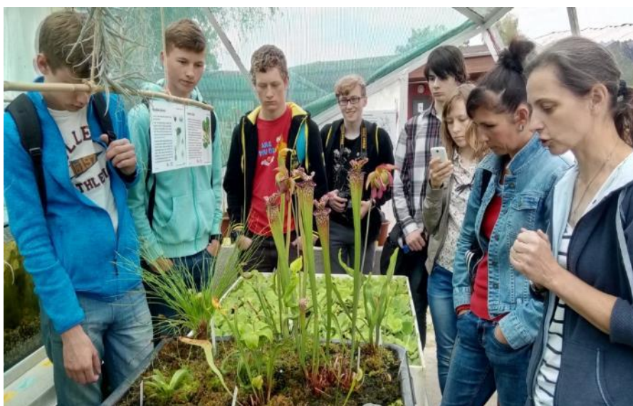
Studenti kvinty u masožravých rostlin v Třeboni

Studenti navštívili v rámci dne otevřených dveří Ústav půdní biologie a Entomologický ústav AV ČR v Českých Budějovicích. Spolupráce probíhá i při vedení našich studentů při pracích Středoškolské odborné činnosti. První ročníky a kvinta se seznámily s mokřadní vegetací a sbírkou řas v Botanickém ústavu AV ČR v Třeboni.