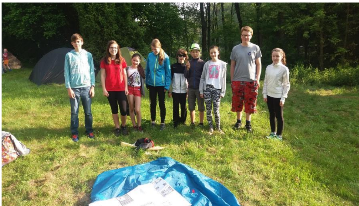
Účastníci soutěže „Zlatý list“.