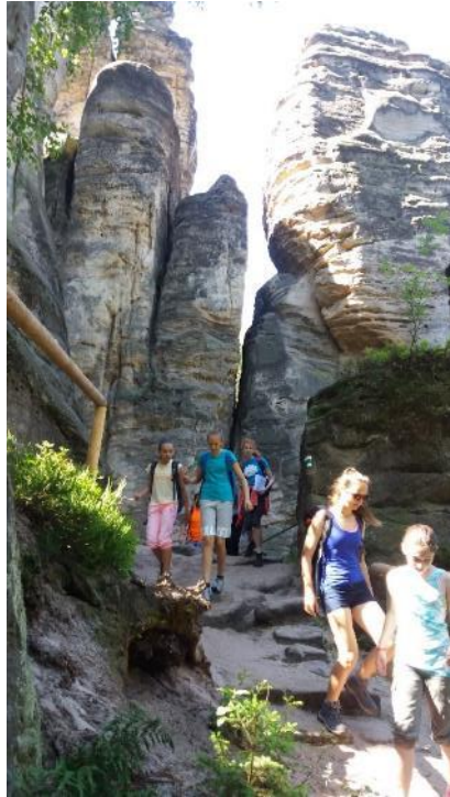
V Prachovských skalách.