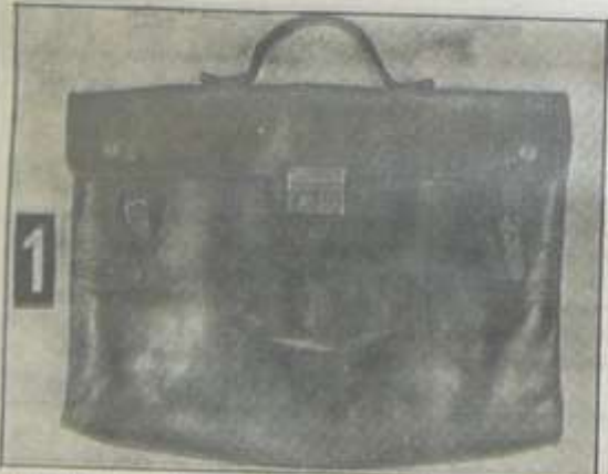
1. Kdo má pachatele anebo kdo zná osoby, ... ...výška ... ...váha ... ...barva ... ...stavba ...