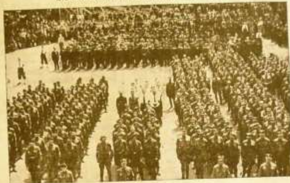
Die Formationen sind angeführt