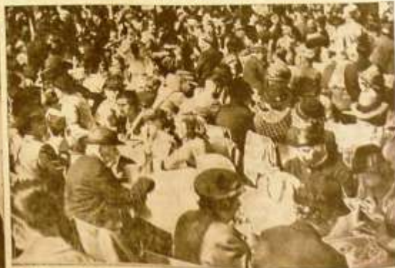
Links: Die SS. — Rechts: manchet das Essen der NSD

Nacistické oslavy 1. Máje 1939 v Budějovicích (slovo „České“ nesmělo být během německé okupace v názvu města používáno)