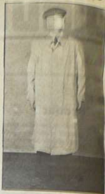
b) oblek akčovní z levné kůže a kšukem ... ...výška ... ...váha ... ...barva ... ...stavba ...