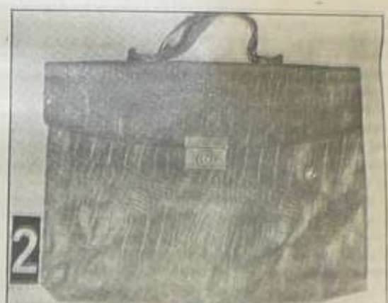
2. Kdo má pachatele anebo kdo zná osoby, ... ...výška ... ...váha ... ...barva ... ...stavba ...