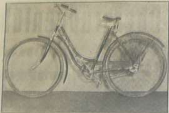
Obilje jednoty Cestovač (4) CTK