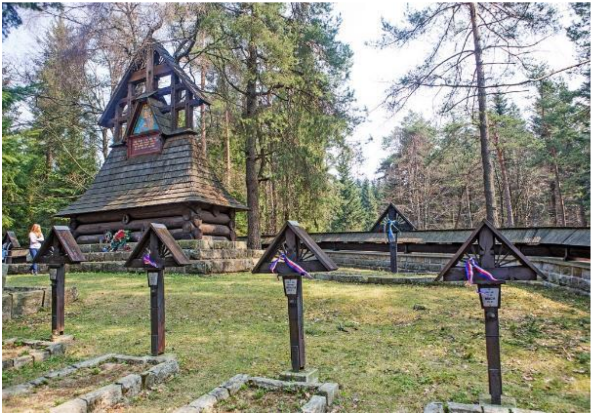
Cesta do pekla